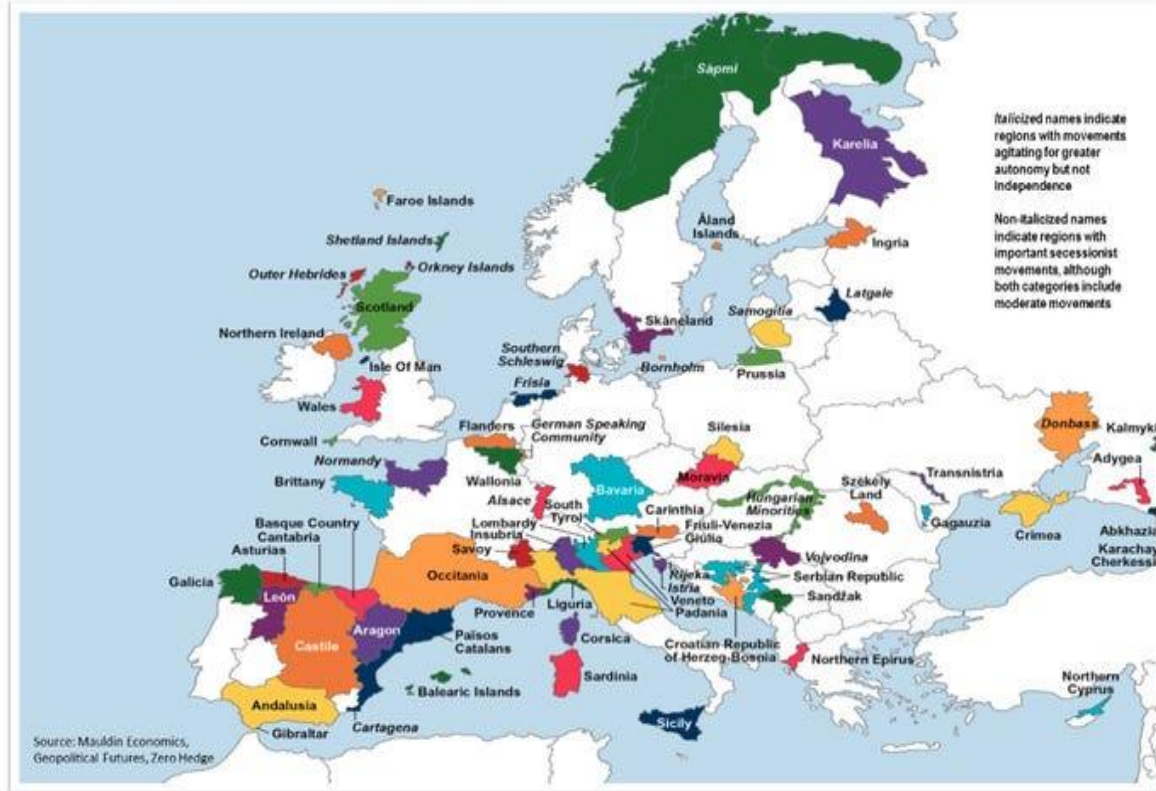
Slika 1: Mapa regiona sa organizovanim političkim pokretima koji se bore za otcjepljenje ili za veću autonomiju (Martin, 2017)

European regions with either secessionist political movements or political movements agitating for greater autonomy